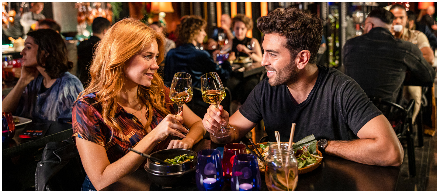
NIGHTLIFE Kinostart: 13. Februar 2020 | Verkaufte Tickets / Admissions: 1.379.279 | © Warner Bros. Der meistbesuchte deutsche Film 2020 | The best-visited German film in 2020