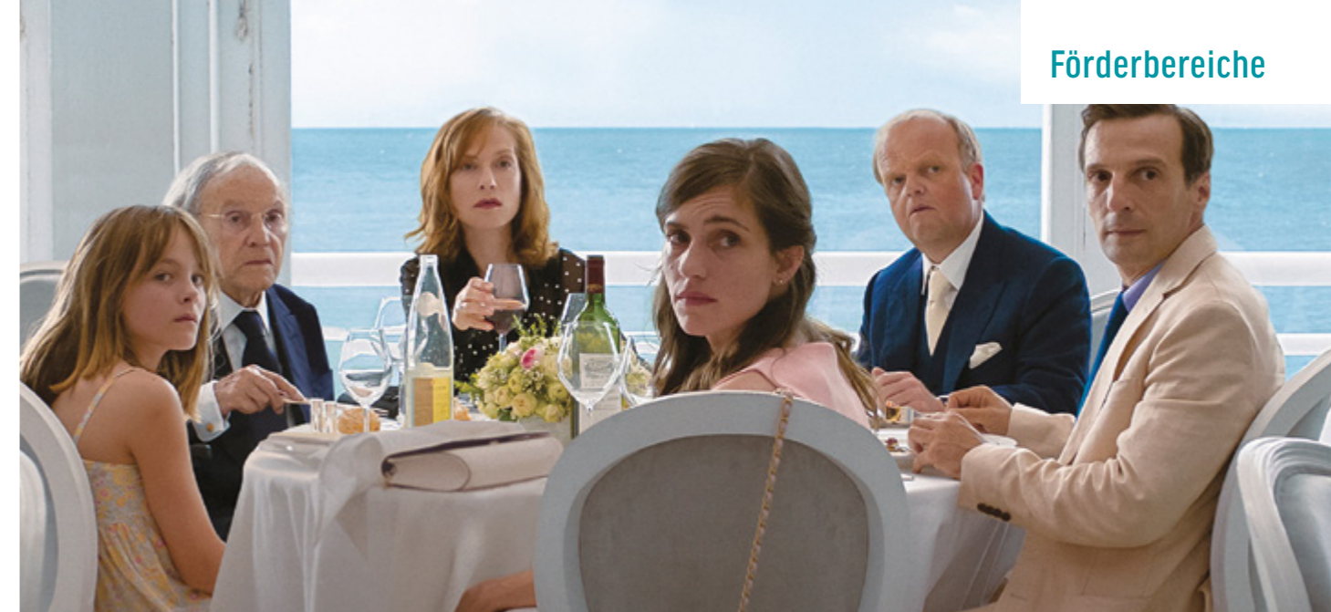
HAPPY END