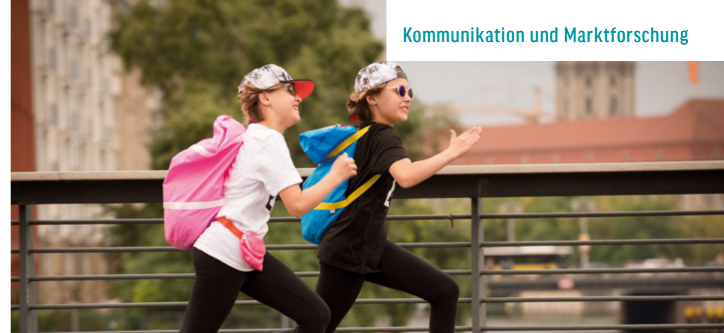
HANNI &amp; NANNI – MEHR ALS BESTE FREUNDE

Unter dem Titel „Unter der Gender-Lupe – Die deutsche Filmbranche“ organisierte die Presse- und Öffentlichkeitsarbeit zur Berlinale eine Informations- und Diskussionsveranstaltung zur Veröffentlichung der Studien „Gender und Film“ / „Gender und Fernsehfilm“. Die von der FFA bzw. ARD und ZDF in Auftrag gegebenen Untersuchungen lieferten erstmals konkrete Zahlen und Antworten zum Thema Gleichstellung von Frauen und Männern in der hiesigen Filmbranche. Im Anschluss an die Präsentationen diskutierten die 130 Teilnehmer/innen im Haus der Commerzbank am Pariser Platz in Berlin unter dem Titel „Konkrete Zahlen – Konkrete Wirkung?“ mit Vertreter/innen der Filmbranche, der ARD und des ZDF über Mittel und Wege, wie die Geschlechtergerechtigkeit in der Film- und Fernsehindustrie voranzubringen ist. Als weiteren Schwerpunkt nahmen die frühzeitig aufgenommenen Vorbereitungen für das 50jährige Bestehen der FFA, das am 6. März 2018 in Berlin gefeiert wurde, einen zunehmend breiten Raum in der Tätigkeit der Kommunikationsabteilung ein.