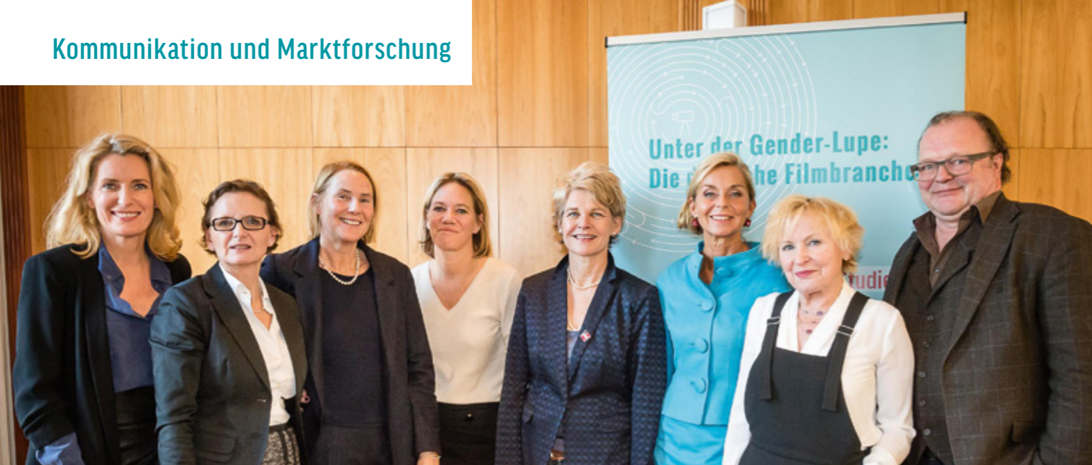
Präsentation der FFA-Studie „Gender und Film“ während der Berlinale