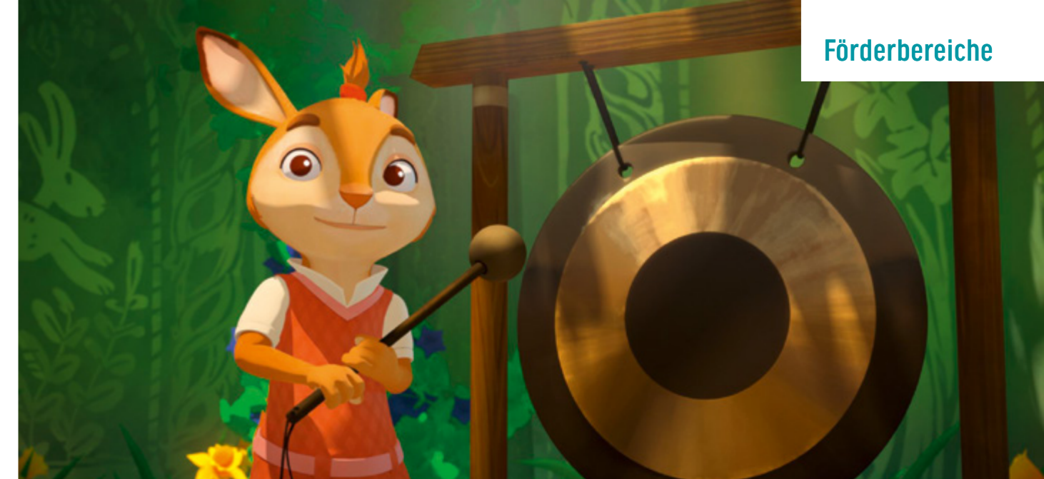
DIE HÄSCHENSCHULE - JAGD NACH DEM GOLDENEN EI

2017 förderte die FFA 2 Projekte: THE WAR HAS ENDED von Hagar Ben-Asher und THE MASSEUR von Małgorzata Szumowska mit insgesamt 90.000 Euro.