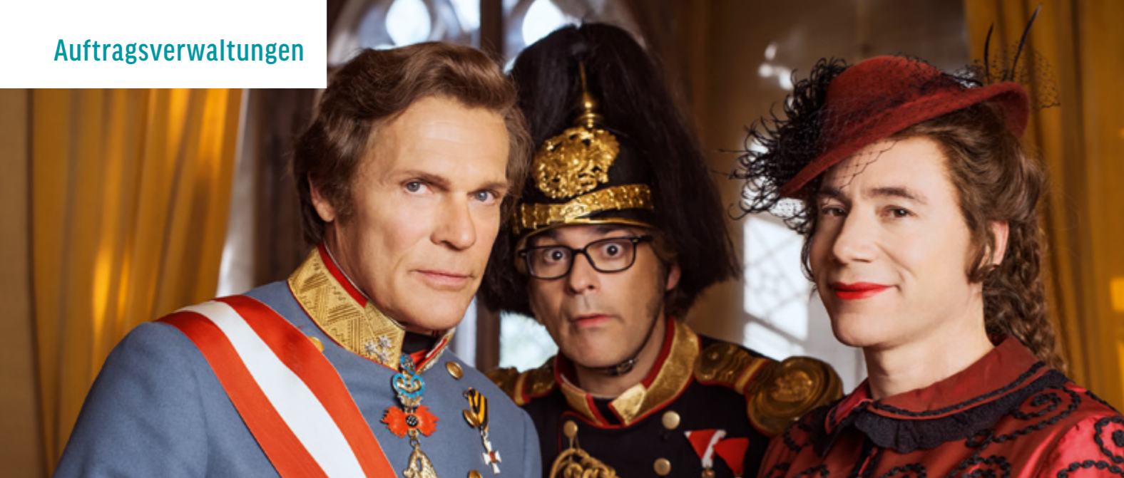
BULLYPARADE – DER FILM