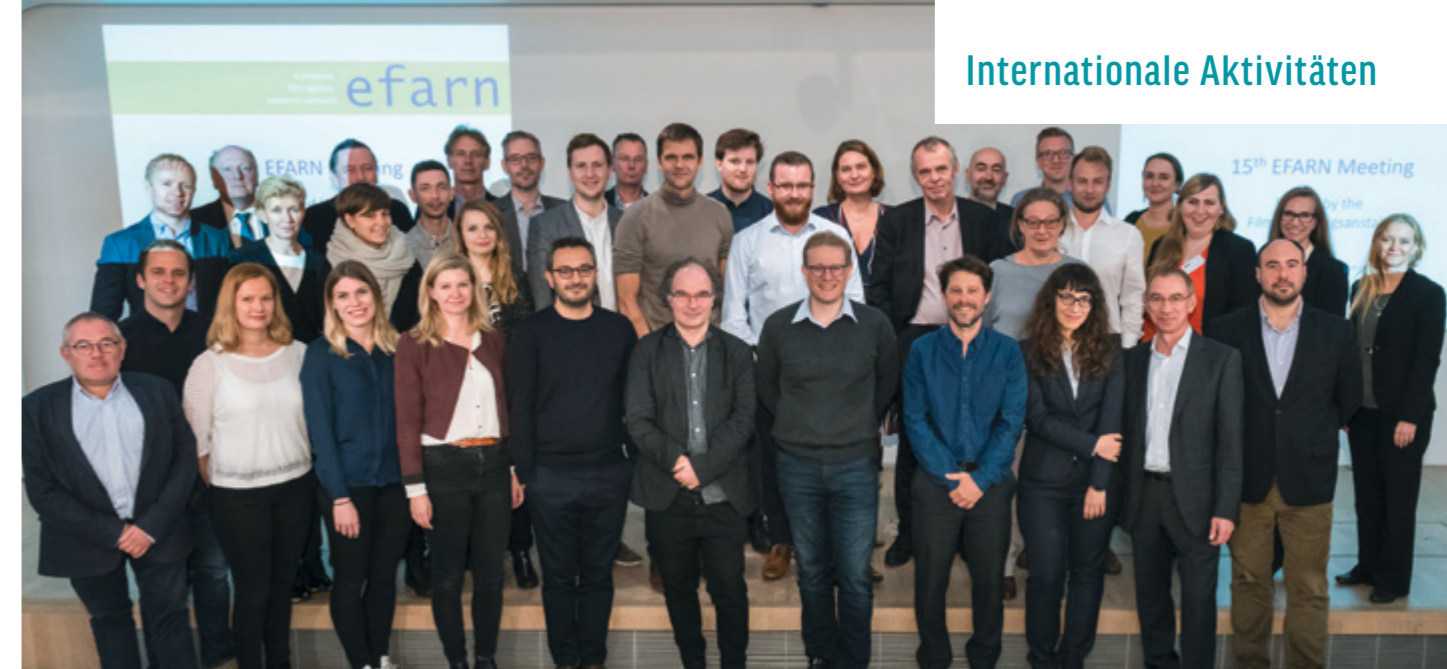
Treffen des European Film Agency Research Network (EFARN) in Berlin

„Europa arbeitet zusammen“, unter diesem zentralen Thema stand das jüngste Treffen des European Film Agency Research Network (EFARN), das vom 23. und 24. Oktober 2017 in Berlin in der Deutschen Kinemathek stattfand. Zwei Tage lang tauschten sich 35 Filmwissenschaftler/innen, Marktforscher/innen und Statistiker/innen aus nationalen und europäischen Spitzenorganisationen der Filmwirtschaft über aktuelle Marktdaten, Analysen und Fakten der europäischen Filmindustrie aus. Schwerpunktthemen des alljährlichen Treffens bildeten diesmal „Die digitale Revolution und deren Auswirkungen auf die europäische Filmindustrie“ sowie „Geschlechterdarstellungen in der europäischen Kinobranche“. Die von der FFA organisierte Konferenz fand nach sieben Jahren wieder in Deutschland statt.