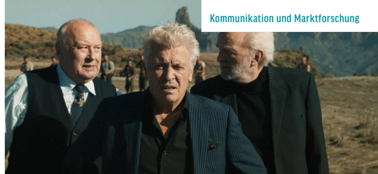
KUNDSCHAFTER DES FRIEDENS

Zum fünften Mal veröffentlichte die FFA Daten über den Besuch/er von 3D-Filmen als eigenständige Publikation im Rahmen der Studienreihe zum Kinobesucher auf Basis der Ergebnisse des GfK-Konsumentenpanels. Danach haben 3D-Filme als Umsatzträger für den deutschen Kinomarkt im Jahr 2016 erneut an Bedeutung gewonnen. Sowohl bei den Besucherzahlen als auch im Umsatz erreichte der 3D-Film die höchsten Anteile im Vergleich zum Gesamtkinomarkt. Mit einem Box-Office von 296 Mio. Euro machten 3D-Vorstellungen 29 Prozent aller Ticketumsätze aus – und lagen nur 3 Prozent unter dem 3D-Box-Office des Ausnahmejahres 2015 (Gesamtmarkt: -12%). 26 Mio. gelöste Kinotickets (-5%, Gesamtmarkt: -14%) und damit fast jeder vierte Besuch (23%) entfiel auf einen 3D-Film. Auffällig ist, dass 3D-Filme beim Blick auf den Anteil der 3D-Besucher im Verhältnis zur Gesamtbesucherzahl deutliche Unterschiede aufweisen. So haben unter den zehn erfolgreichsten 3D-Filmen neun von zehn Kinobesuchern (90,2%) den Actionfilm DOCTOR STRANGE in 3D gesehen, die Animationsfilme ZOO-MANIA (41,8%) und PETS (44,4%) jedoch noch nicht einmal jeder Zweite.