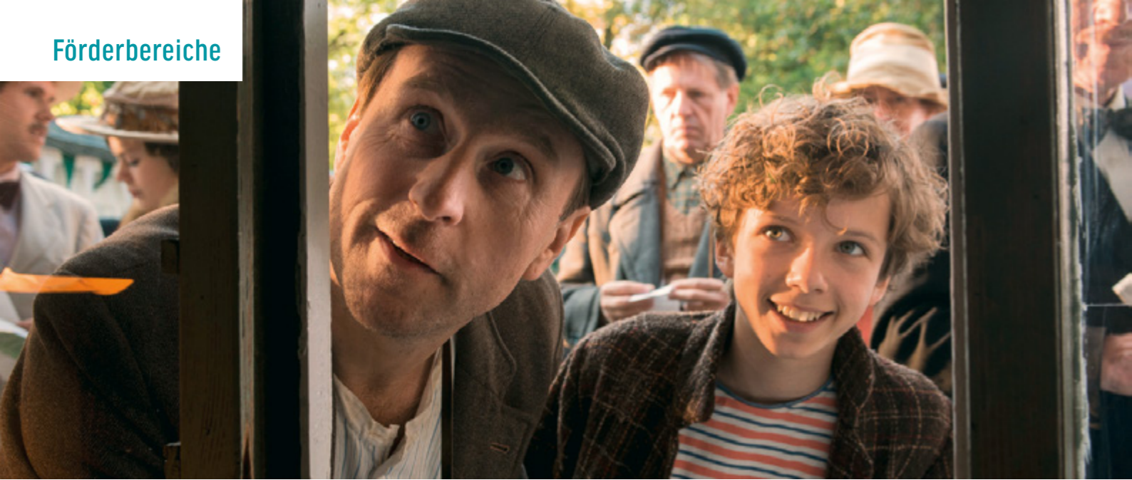
TIMM THALER ODER DAS VERKAUFTE LACHEN

Elementare Aufgabe der FFA ist die Förderung des deutschen Films. Dies kann auf die unterschiedlichste Weise geschehen. In diesem Bericht spiegeln wir ein Gesamtbild der Förderaktivitäten der FFA wider. Es werden die einzelnen Förderbereiche dargestellt, und es wird dargelegt, welche Mittel in den einzelnen Bereichen eingesetzt wurden. Hier kann aber nur ein grundsätzlicher Überblick gegeben werden.