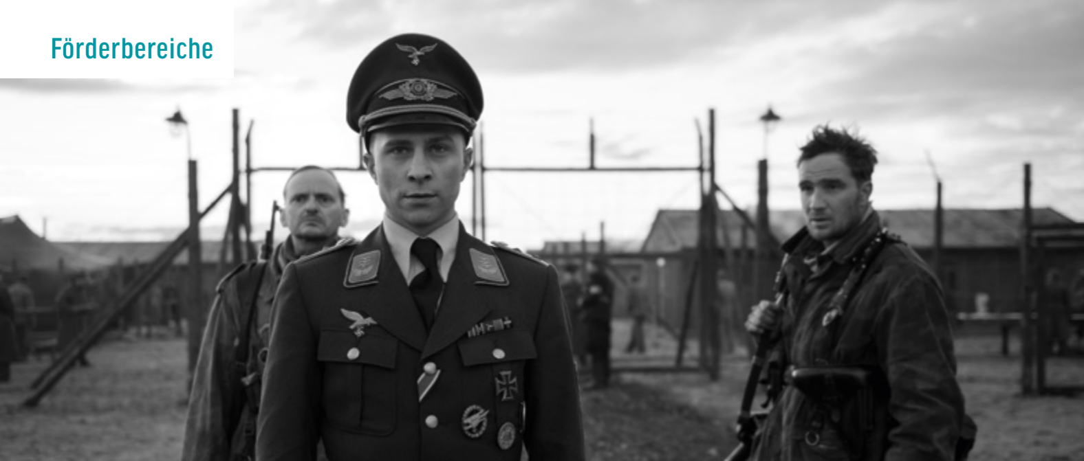
Der Hauptmann