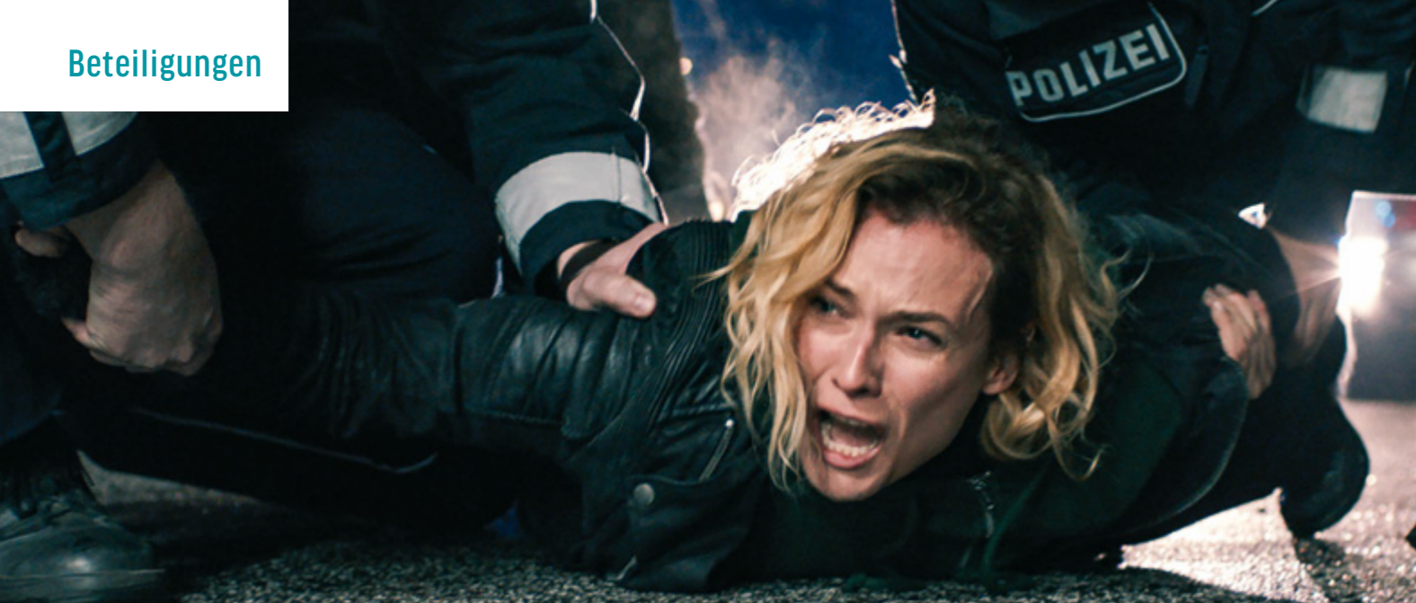
AUS DEM NICHTS