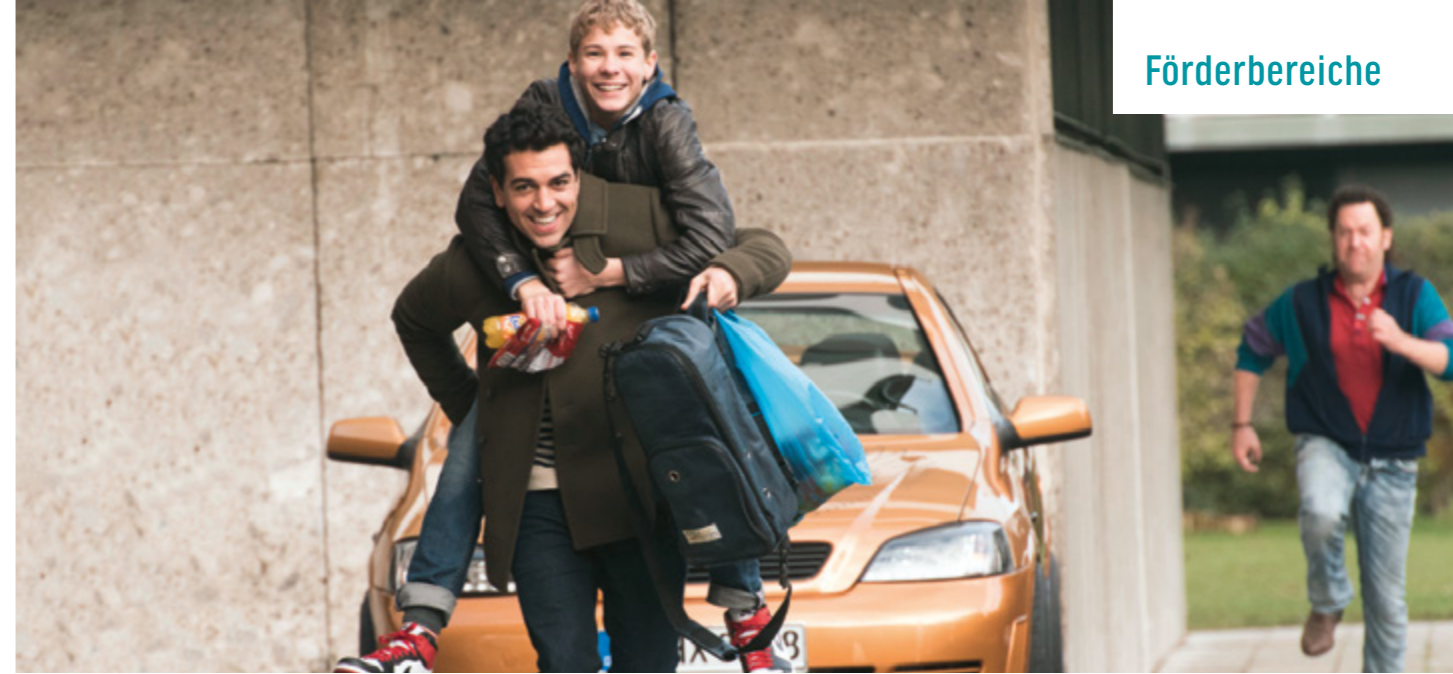
DIESES BESCHEUERTE HERZ