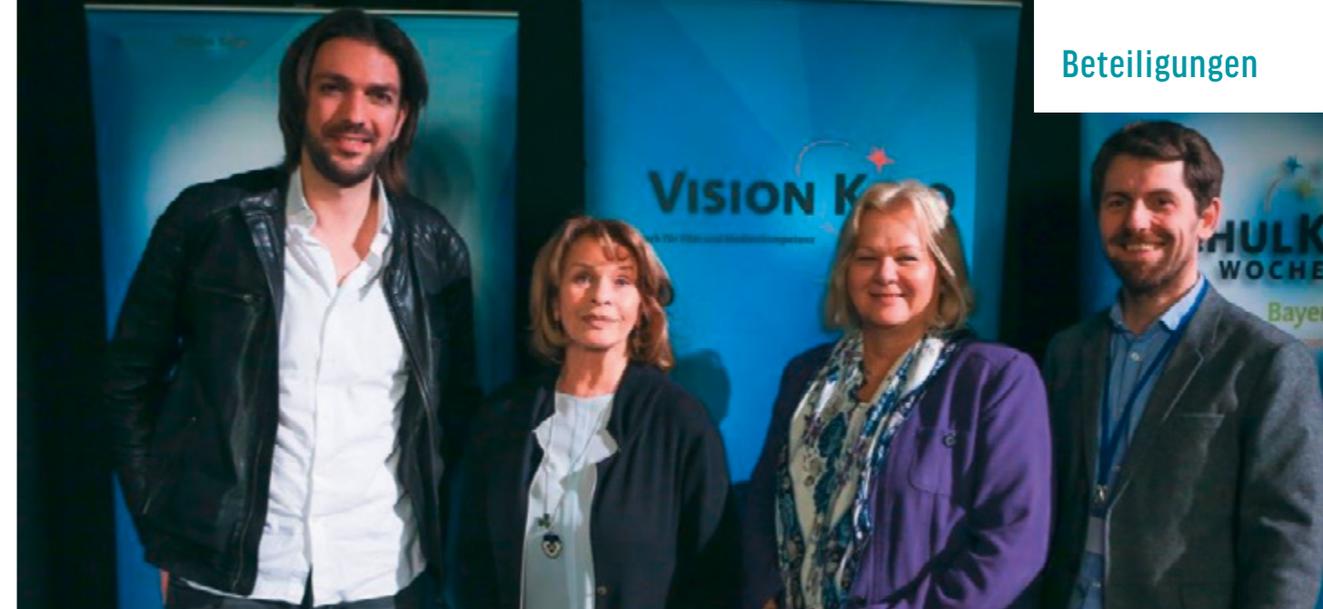
AUFNAHME DER SCHULKINO WOCHE BAYERN 2017

In Runde zwei ging die German-Films-Initiative FACE TO FACE WITH GERMAN FILMS, welche auf aktuelle deutsche Filmfolge international aufmerksam macht und außerordentliche Talente aus Deutschland weltweit präsentiert. 2017 rückte sie sechs der derzeit vielversprechenden deutschen Schauspieler in den Mittelpunkt.