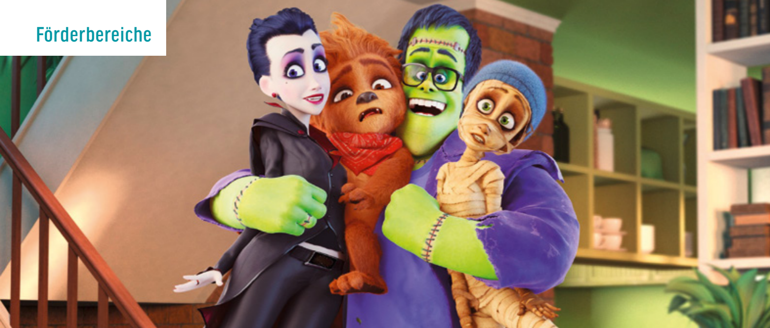
HAPPY FAMILY