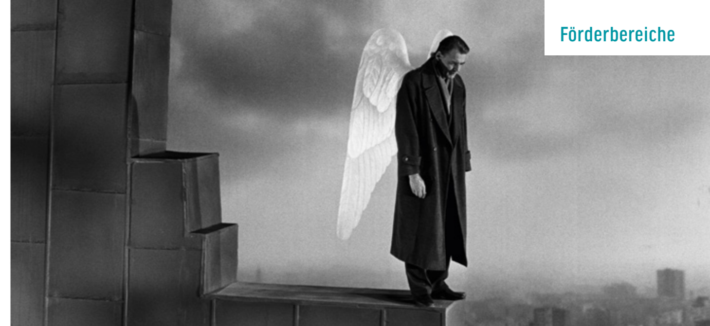
DER HIMMEL ÜBER BERLIN | © WIM WENDERS STIFTUNG

Verteilung der Referenzpunkte entsprechend der Antragstellung: 171 Leinwände – 1 Referenzpunkt Kinoprogrammpreis der BKM 119 Leinwände – 1 Referenzpunkt deutsch/europäischer/EWR/Schweiz Besucheranteil 9 Leinwände – 2 Referenzpunkte deutscher Besucheranteil 114 Leinwände – 3 Referenzpunkte Kinoprogrammpreis/deutscher Besucheranteil 150 Leinwände – 3 Referenzpunkte deutscher und deutsch/europäischer Besucheranteil