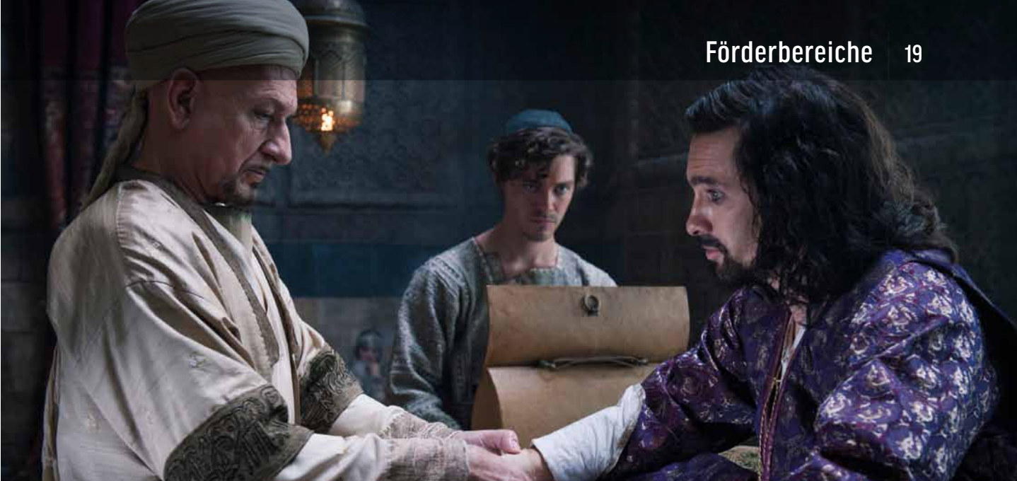
DER MEDICUS | UNIVERSAL