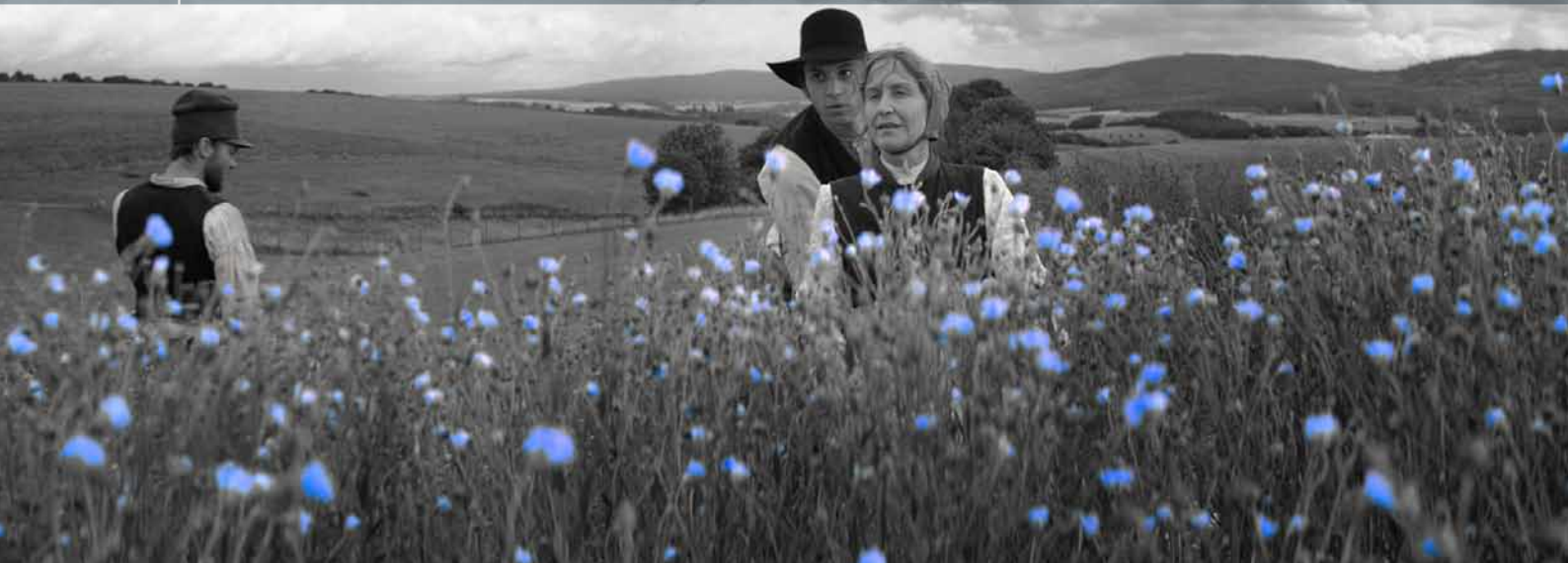
DIE ANDERE HEIMAT – CHRONIK EINER SEHNSUCHT | CONCORDE