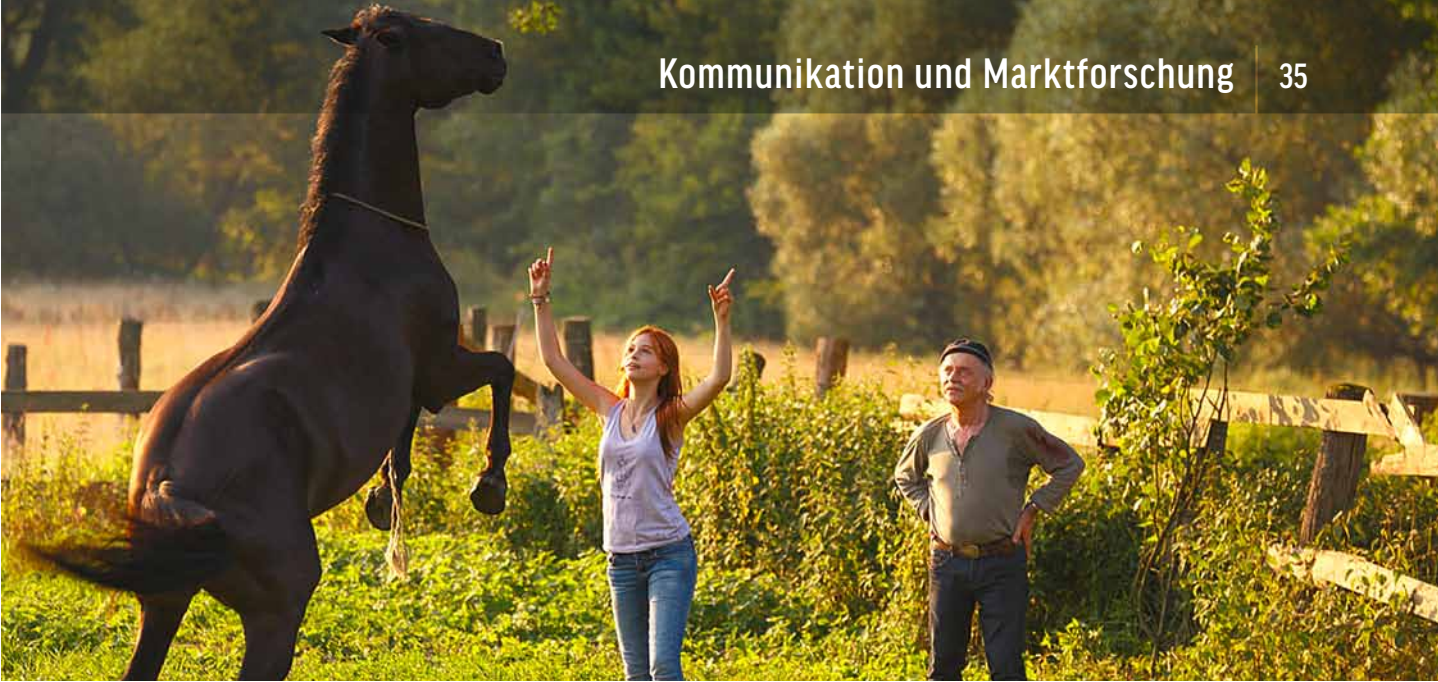
OSTWIND – ZUSAMMEN SIND WIR FREI | CONSTANTIN