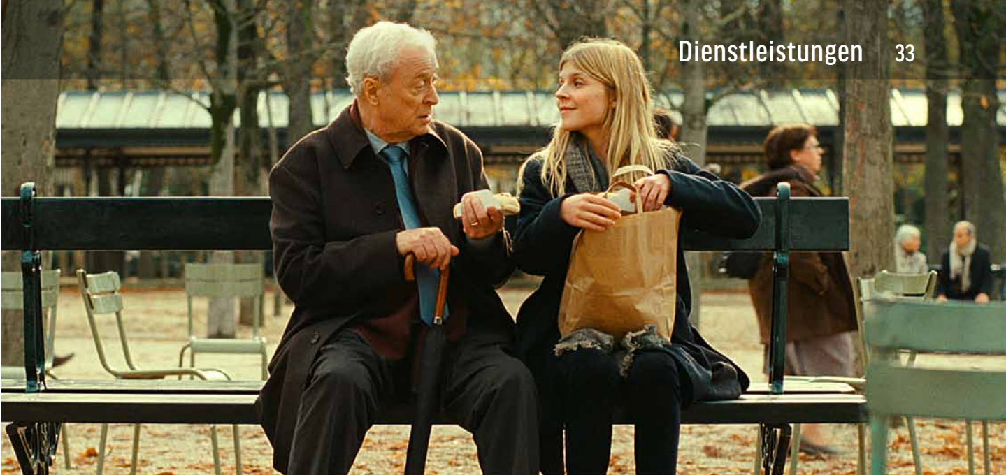
MR. MORGAN'S LAST LOVE | SENATOR