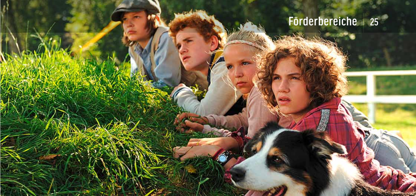
FÜNF FREUNDE 2 | CONSTANTIN