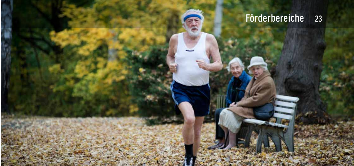
SEIN LETZTES RENNEN | UNIVERSUM