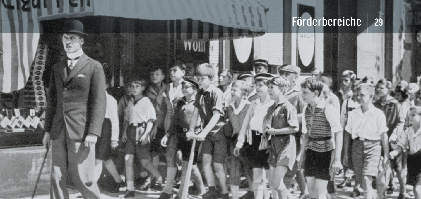
SEIT 2013 AUCH DIGITAL: EMIL UND DIE DETEKTIVE | MFA