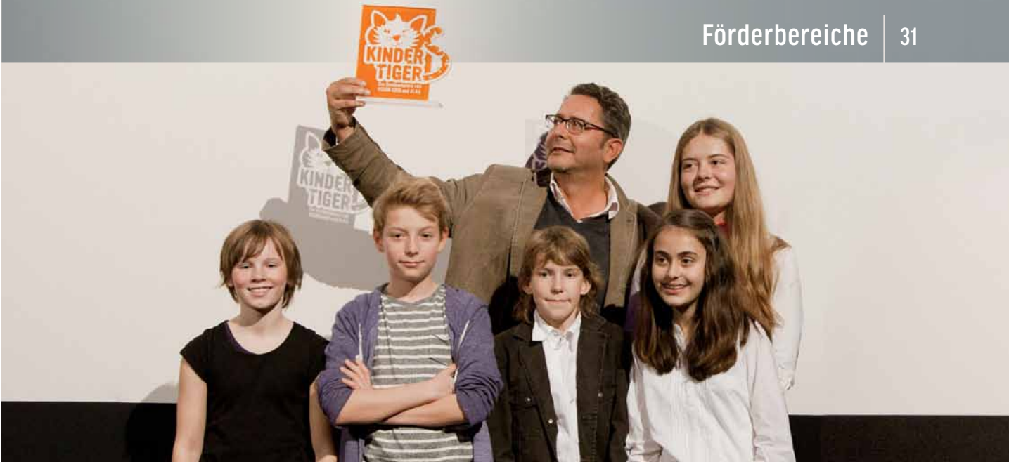
VON DER FFA FINANZIERT: DER KINDERTIGER 2013 FÜR DIE AUTOREN DES DREHBUCHS „DIE ABENTEUER DES HUCK FINN“ | GERGAN PETROVA