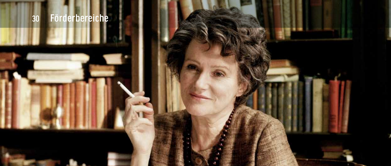
HANNAH ARENDT